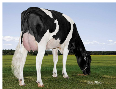
MGD: Sully Robust 720-ET