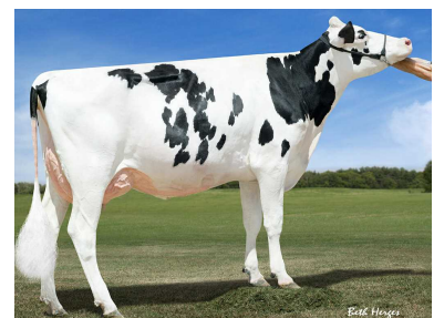
MGGD: Dymentholm Sunview Sunday